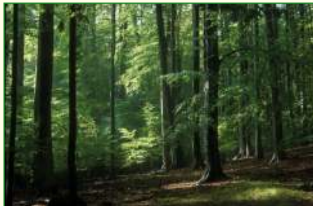
Hout uit duurzaam beheerd bos herken je aan het FSC-label.

In het buitenland zijn er nog enkele andere labels te vinden, zoals dat van het Nederlandse 'Stichting Keurhout' of het strenge Duitse 'Naturland'-label.