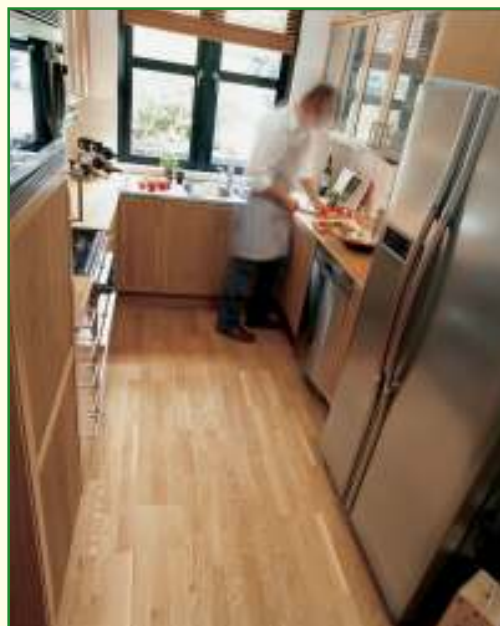
Ook in de keuken kan een houten vloer...

Emissies van vluchtig organische componenten bij houten vloerbekledingen zijn meestal te wijten aan het gebruik van lijm en producten om hout te 'verduurzamen' (beschermen tegen schimmels en insecten). Sommige houtsoorten (met name een aantal dennenhoutsoorten) hebben echter wel een uitstoot van natuurlijke solventen, afkomstig uit de harsen. Deze natuurlijke solventen worden ook gerekend onder de ongezonde stoffen.