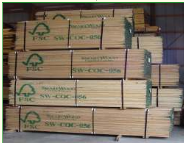
Hout met FSC-label: garantie voor verantwoord bosbeheer

De Raad van het 'Programma voor toelating van boscertificeringssystemen' ( PEFC : Programme for the Endorsment of Forest Certification schemes) is een non-profit en niet-gouvernementele organisatie die duurzaam bosbeheer stimuleert. PEFC is opgestart vanuit de Europese bosbouwsector, die het FSC-label niet overal in Europa toepasbaar vond. PEFC voorziet in een boscertificeringssysteem dat gebaseerd is op onderlinge erkenning van nationale of regionale boscertificeringssystemen. Zij heeft eigen internationaal geaccep-