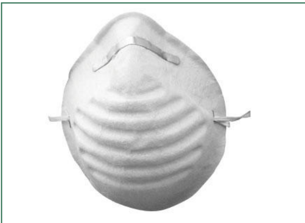
Een stofmasker beschermt je tijdens het afschuren van verf.

Stof dat tijdens het schuren vrijkomt is ongezond om in te ademen. Oude verflagen kunnen bovendien lood bevatten, dat bij het schuren in de vorm van stof wordt verspreid in de ruimte. Inademing van dit stof is gevaarlijk. Zet altijd een stofkapje op, maak de ondergrond nat en werk met waterbestendig schuurpapier.