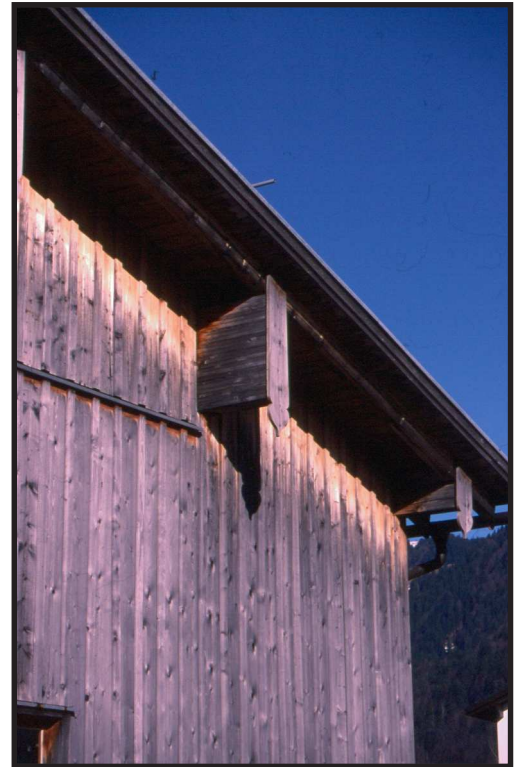
De dakoversteek beschermt rechtstreeks tegen bevochtiging van de gevelbeplanking bovenaan. De afwerking van de horizontale balken zorgt voor bescherming van het kopse hout.

Wanneer hout afgeschermd is van directe neerslag komt spintvrij hout van zowel zeer duurzame (klasse I), duurzame (klasse II) als matig duurzame (klasse III) houtsoorten in aanmerking voor toepassing.