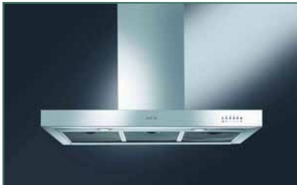
Een degelijke dampkap is tijdens het koken onontbeerlijk.