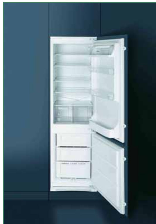
Koelkast met diepvriesmodel

Volgens Top Ten liggen de kosten voor het energieverbruik van een koelkast vaak hoger dan de aankoopprijs: "de elektriciteitsrekening ligt gemiddeld op €1.000, gerekend over 15 jaar (de gemiddelde levensduur van een koelkast). Maar dankzij een goed werkende koelkast is het mogelijk om dit verbruik voor dezelfde prestaties met meer dan 50% te verminderen."