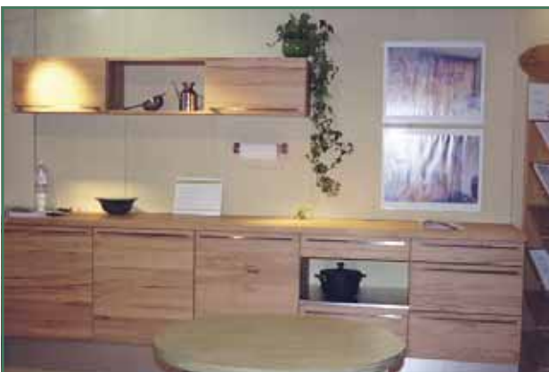
Een houten keukenblad dat met plantaardige olie en/of was is afgewerkt is volgens VIBE het meest ecologisch.