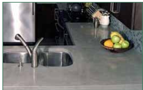
Een betonnen keukenblad

Ook een betonnen keukenblad kun je zelf maken. Dit kun je eventueel met tadelakt (waterdichte glanspleister op basis van kalk) afwerken. Tadelakt is echter enkel betaalbaar als je het zelf kan doen (€ 20 /m 2 i.p.v. € 150 /m 2 ). Je kan bij verschillende handelaars in ecologische materialen workshops tadelakt volgen. Tadelakt is zelfs goedkoper dan tegels indien je het werk zelf uitvoert.