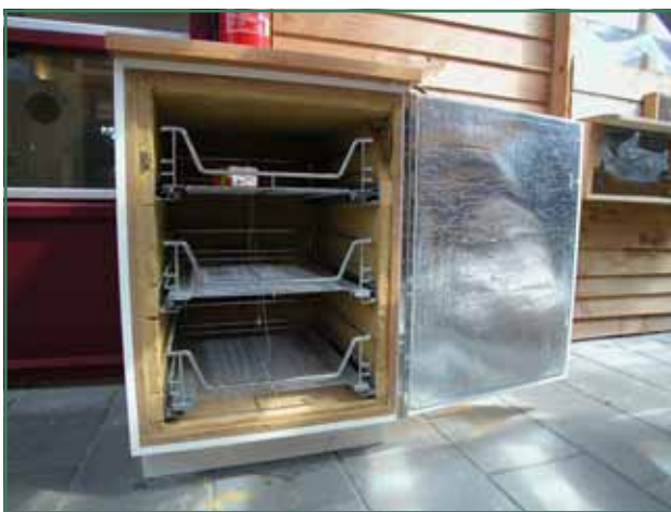
De koele kast op de VIBA-expo in 's Hertogenbosch (NL).

Is je koelkast te klein voor alle drank? Maak dan een stroomloze koele kast. Dit is een kast die door koel water langs de wanden te laten lopen op lage temperatuur gehouden wordt.