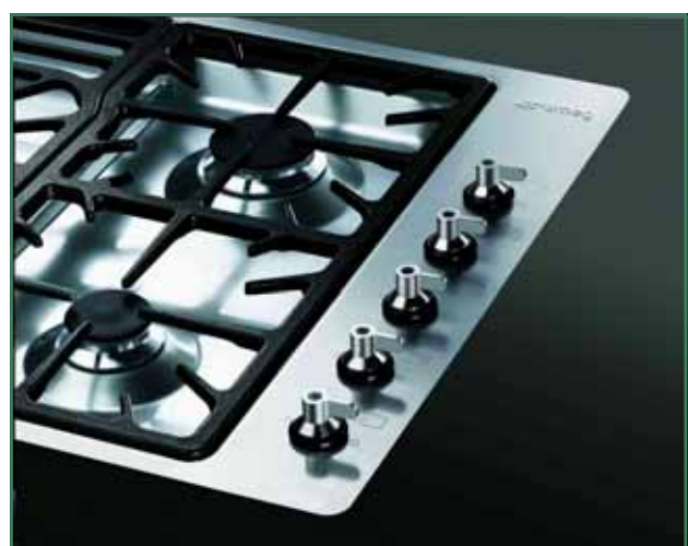
Koken op gas is minder milieubelastend en voordeliger dan koken op elektriciteit.

Gasfornuizen zijn iets duurder dan elektrische, maar omdat ze minder verbruiken, kan er per jaar € 50 uitgespaard worden, zodat de aanschaf van een duurder apparaat gerechtvaardigd wordt.