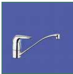
Met een ééngreepsmengkraan kan je warm en koud water met behulp van 1 hendel mengen