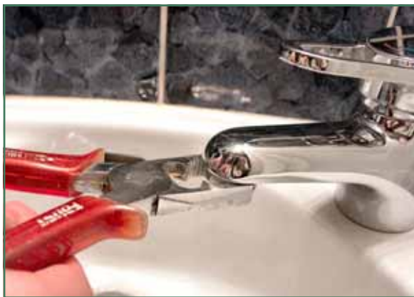
Een bruismondstuk kan je gemakkelijk zelf monteren.