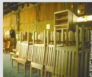
GHI-COC-362 Producent stoelen

Bij de aankoop van FSC gecertificeerd materiaal is het van essentieel belang dat op de aankoopdocumenten het certificaatnummer van uw leverancier vermeld staat.