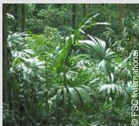
ABC-FM-0145 Gecertificeerd bos

Het laatste deel vervolledigt de code en maakt deze uniek. Dit laatste deel bestaat doorgaans uit een nummer, al dan niet vergezeld van bijkomende letters (bv bij groepslicenties).