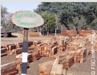
DEF-FM/COC-1241 Exploitant en zagerij