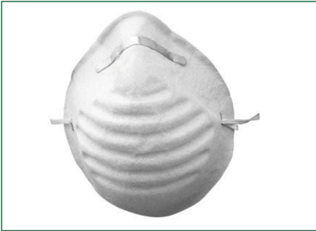
Een stofmasker beschermt je tijdens het afschuren van verf.

Stof dat tijdens het schuren vrijkomt is ongezond om in te ademen. Oude verflagen kunnen bovendien lood bevatten, dat bij het schuren in de vorm van stof wordt verspreid in de ruimte. Inademing van dit stof is gevaarlijk. Zet altijd een stofkapje op, maak de ondergrond nat en werk met waterbestendig schuurpapier.