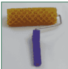
Rol met honingraten.